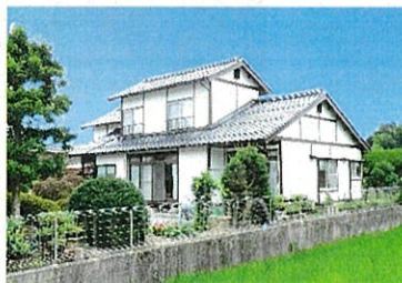
地域活動支援センター あけぼの