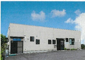
就労継続支援B型事業所 松江あけぼの作業所